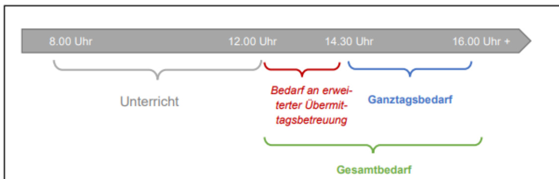
Abbildung 1: Schematische Darstellung der zusätzlichen Betreuungsbedarfe aus der Studie des Deutschen Jugendinstituts (DJI) zu den Gesamtkosten des geplanten Rechtsanspruches

Zur Umsetzung ihres Vorhabens hatten das Bundesministerium für Bildung und Forschung und das Bundesministerium für Familie, Senioren, Frauen und Jugend im Januar 2020 zunächst einen Gesetzesentwurf zur Errichtung eines Sondervermögens „Ausbau ganztägiger Bildungs- und Betreuungsangebote für Kinder im Grundschulalter“ (kurz: Ganztagsfinanzierungsgesetz – GaFG) vorgelegt. Die ursprünglichen Planungen sahen vor, dass insgesamt 2 Milliarden Euro in Form von Finanzhilfen für die Bundesländer gemäß Artikel 104c des Grundgesetzes bereitgestellt werden, um die Ganztagsangebote in den Grundschulen auszubauen. Diese Summe ist dann in der Folge um 1.5 Milliarden auf 3,5 Milliarden Euro aufgestockt worden . Mit diesen Mitteln wird eine bis zu 70-prozentige Beteiligung des Bundes an den Investitionen geschaffen. Alle weiteren Kosten tragen die Länder und Kommunen. Das vom BMFSFJ und dem Bundesministerium für Bildung und Forschung (BMBF) finanzierte und verwaltete