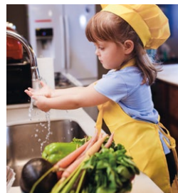
Unsere Empfehlungen, S.5