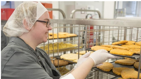
Barrierefreies kochen: Mit der Systemlösung von apetito können nun auch die Beschäftigten in die Küchenprozesse eingebunden werden.

„Anfangs relativ easy. Wir wussten frühzeitig was auf uns zukommt und hatten im Wohnheim bereits Convectomaten mit ähnlicher Bedienung. Außerdem waren wir gemeinsam bei apetito in Rheine und haben alles schon mal vor Ort gesehen.“